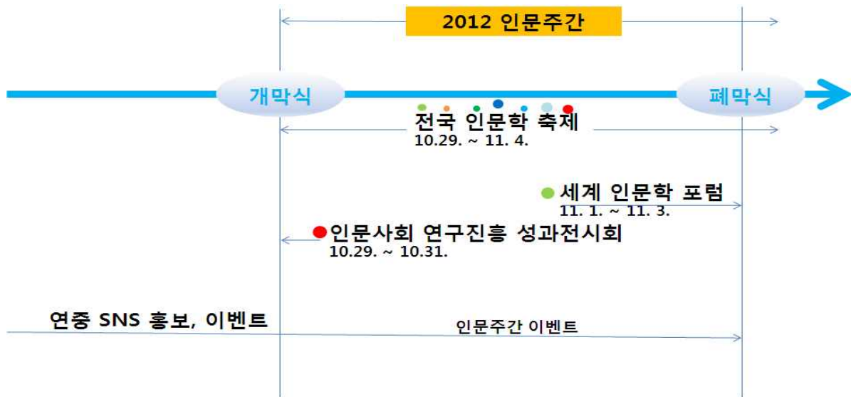
< 2012 인문주간 행사 개요 >